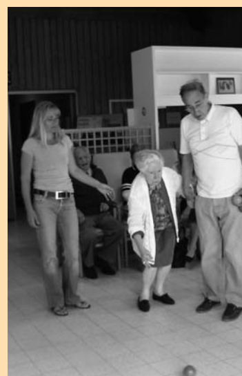
Ontspanning in de Siriusgarde