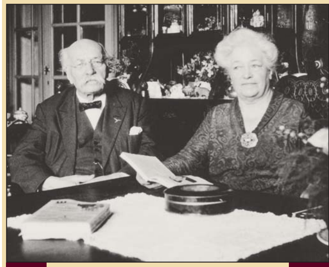
Henri Lafontaine et son épouse dans la salle à manger de leur maison square Vergote, 1932

En 1968, la commune de Woluwe-Saint-Lambert donne le nom d'Henri Lafontaine à une nouvelle artère du quartier Hof ten Berg afin de perpétuer le souvenir de cette éminente personnalité.