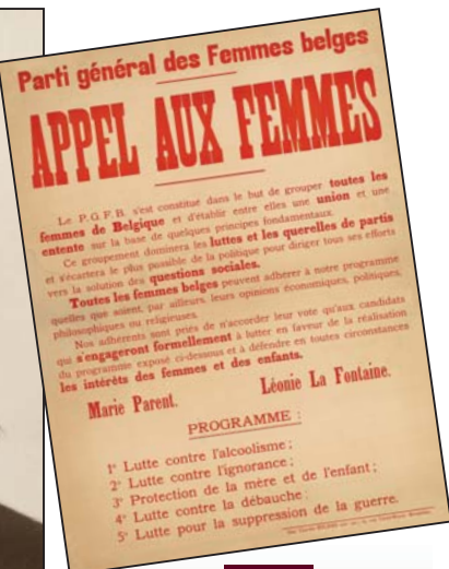
« Appel aux femmes », affiche du Parti général des femmes belges (créé à l'initiative de la Ligue belge du droit des femmes), signée Marie Parent et Léonie Lafontaine, la sœur d'Henri Lafontaine, 1921