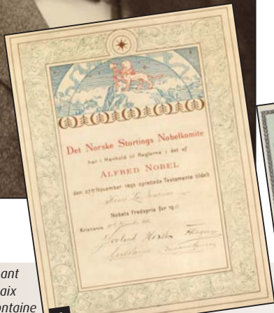
1. Diplôme accompagnant le prix Nobel de la paix attribué à Henri Lafontaine en 1913