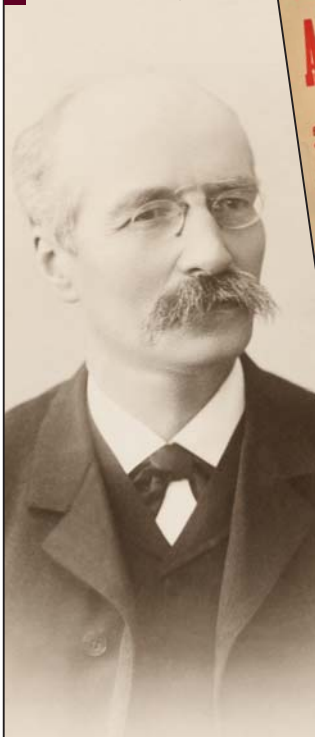
Henri Lafontaine, rond 1900