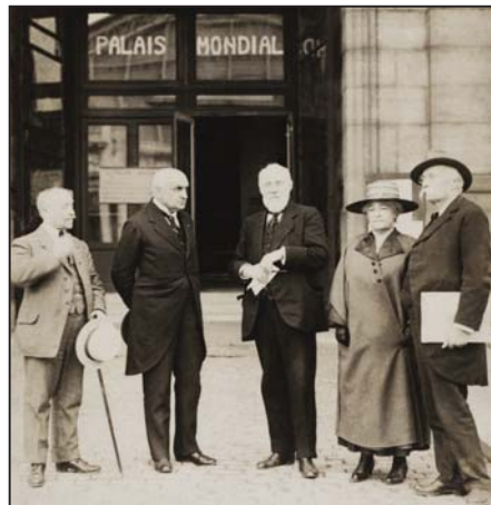
Paul Otlet (au centre) et Henri Lafontaine (à droite) devant l'entrée du Palais mondial-Mundaneum au Palais du Cinquantenaire, (années 1920)