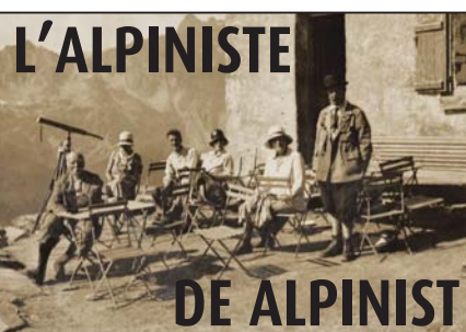
Excursion en montagne: halte au chalet-hôtel du Plan de l'Aiguille (France), août 1930 Uitstap in de bergen: verpozen bij het chalet-hotel van het 'Plan de l'Aiguille' (Frankrijk), augustus 1930

Henri Lafontaine is ervan overtuigd dat de vrijmetselaars buiten de muren van hun tempels moeten treden, zowel nationaal als internationaal. Vandaar ook zijn interesse voor de Internationale liga voor vrijmetselaars, in 1902 opgericht vanuit pacifistische beweegredenen, en zijn medewerking aan de oprichting van de Universele liga van vrijmetselaars in 1913 – hij wordt voorzitter van de Belgische afdeling, opgericht in 1929.