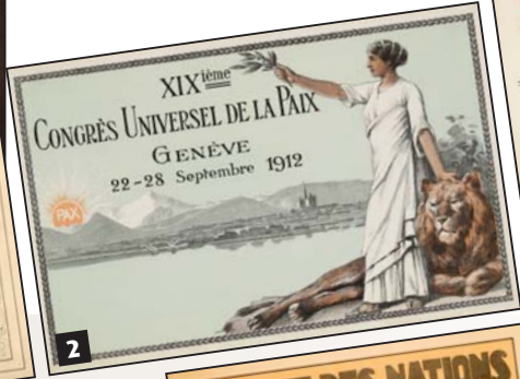
2. Carte postale émise à l'occasion du XIXe Congrès universel de la paix, 1912