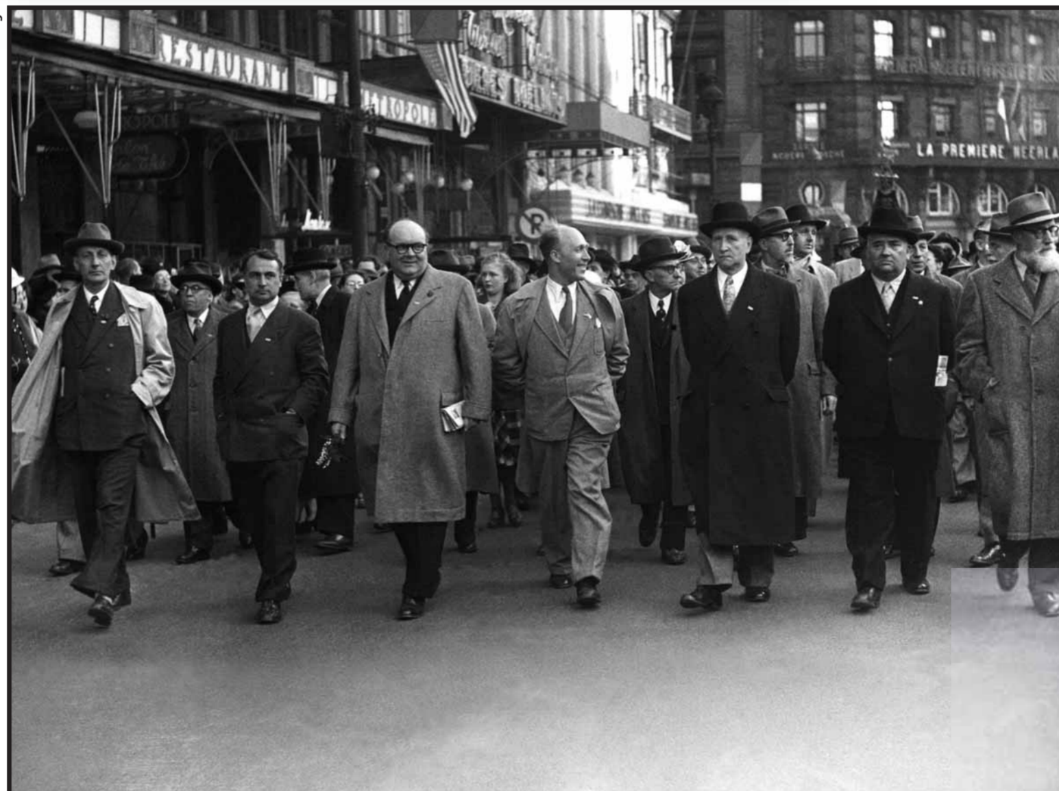
Bruxelles – Paul-Henri Spaak et d'autres personnalités à la tête du cortège du 1 er mai 1949

Paul-Henri Spaak retired from politics in 1966. However, he remained an attentive observer and well-informed commentator on Belgian and international politics until his death in 1972.