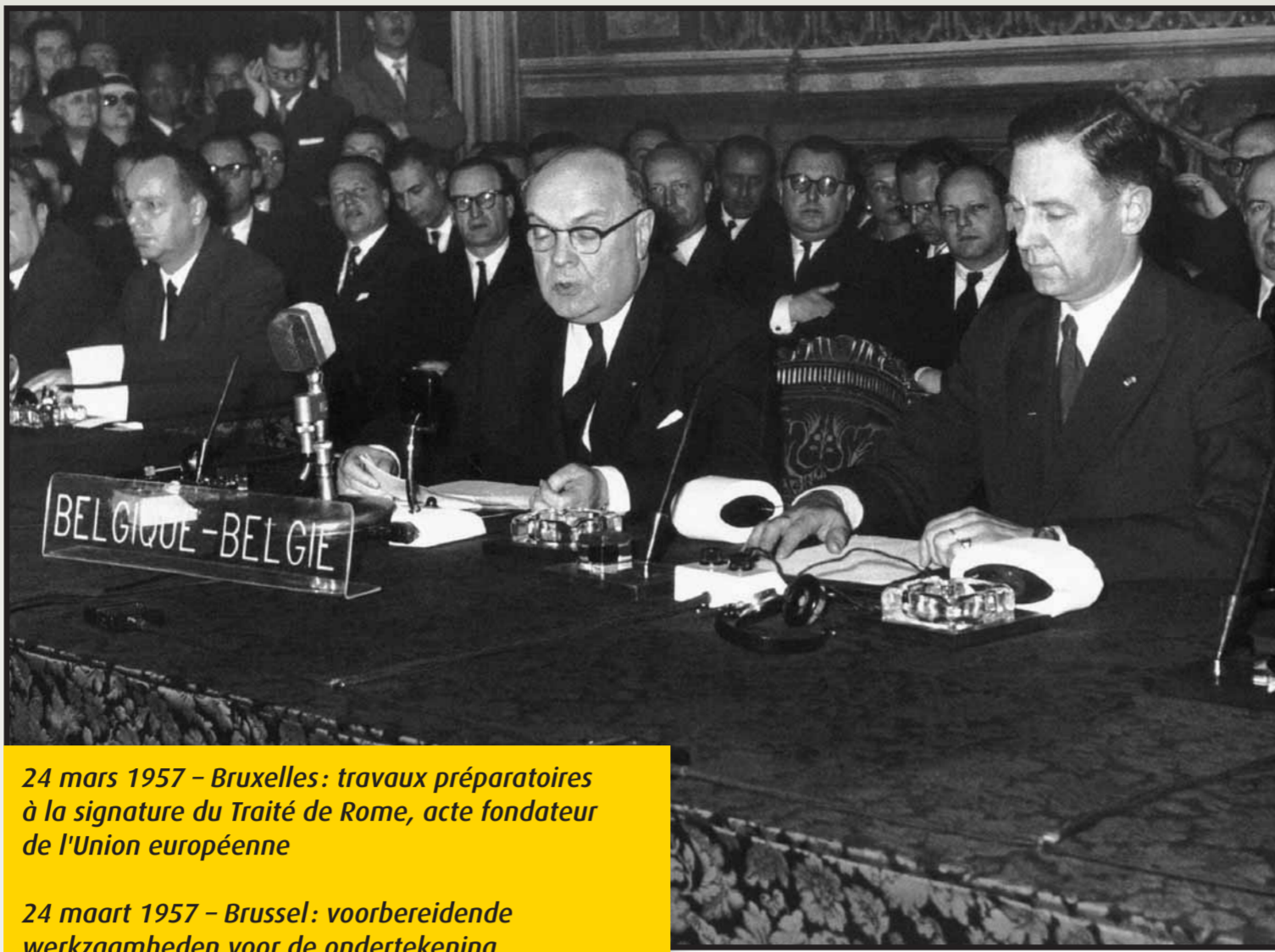
24 mars 1957 – Bruxelles: travaux préparatoires à la signature du Traité de Rome, acte fondateur de l'Union européenne