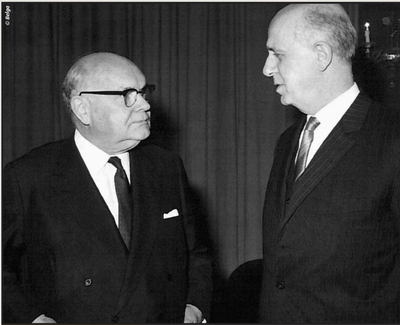
Paul-Henri Spaak, Ministre des Affaires étrangères et Pierre Harmel Premier Ministre