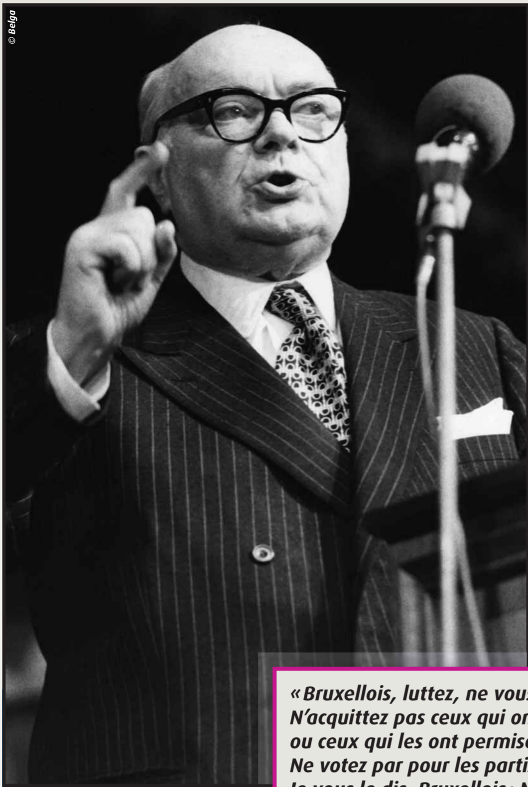
Paul-Henri Spaak, un très grand orateur