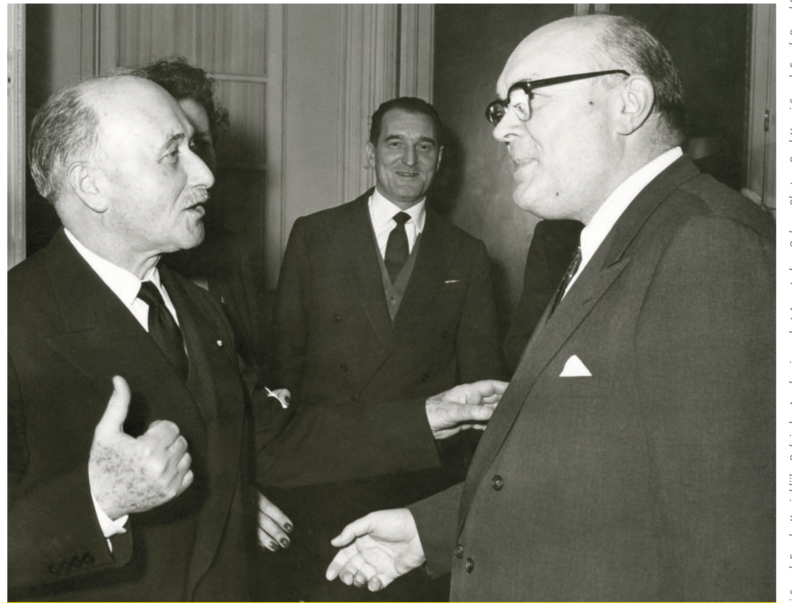
Paul-Henri Spaak et Jean Monnet.

S'étant retiré de la vie politique en 1966, il poursuivra avec intérêt l'évolution de la construction européenne, persuadé de son absolue nécessité pour la sauvegarde du continent, insistant notamment sur l'urgence de lui conférer une dimension politique.