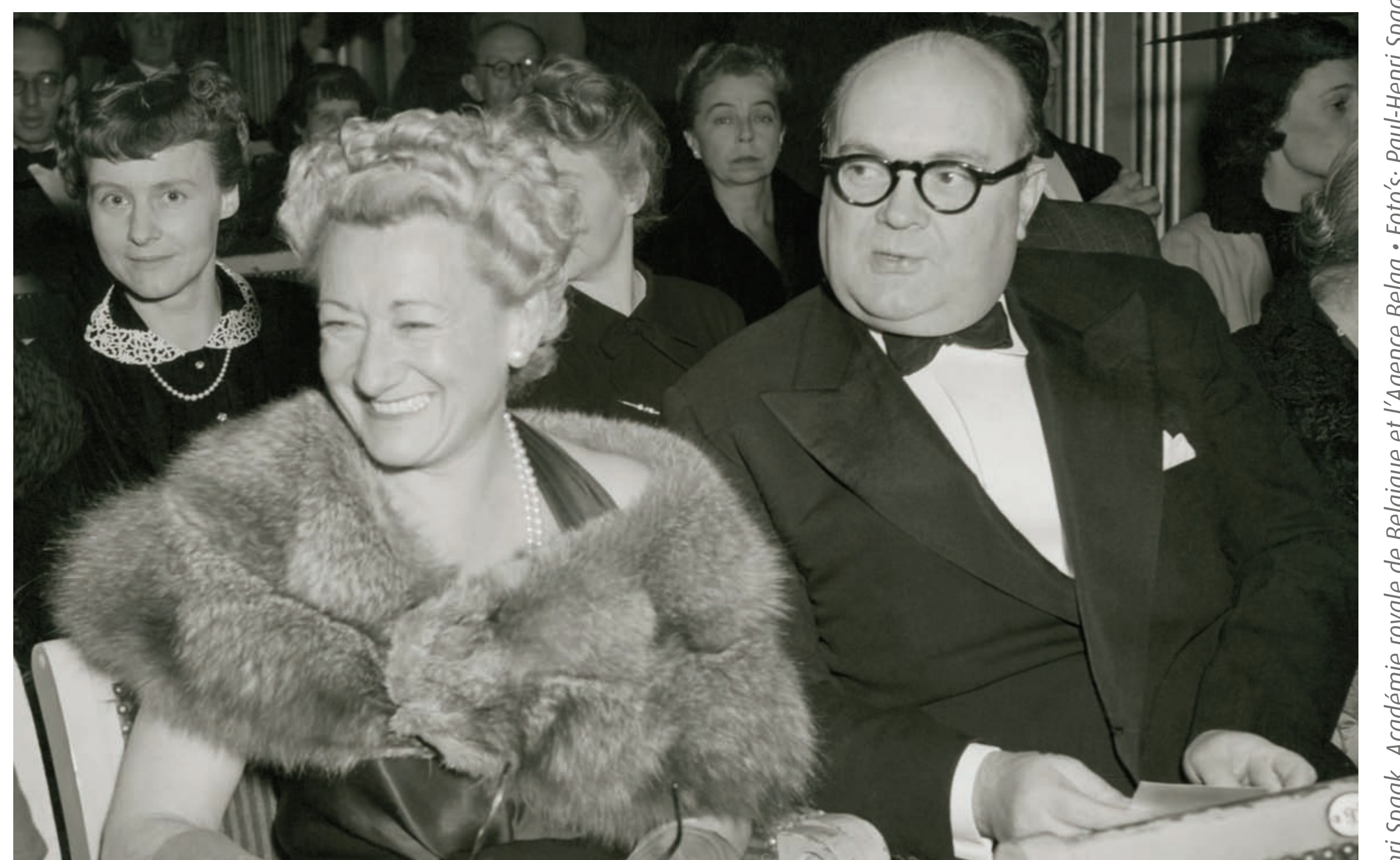
Paul-Henri Spaak et sa femme Marguerite Malevez.