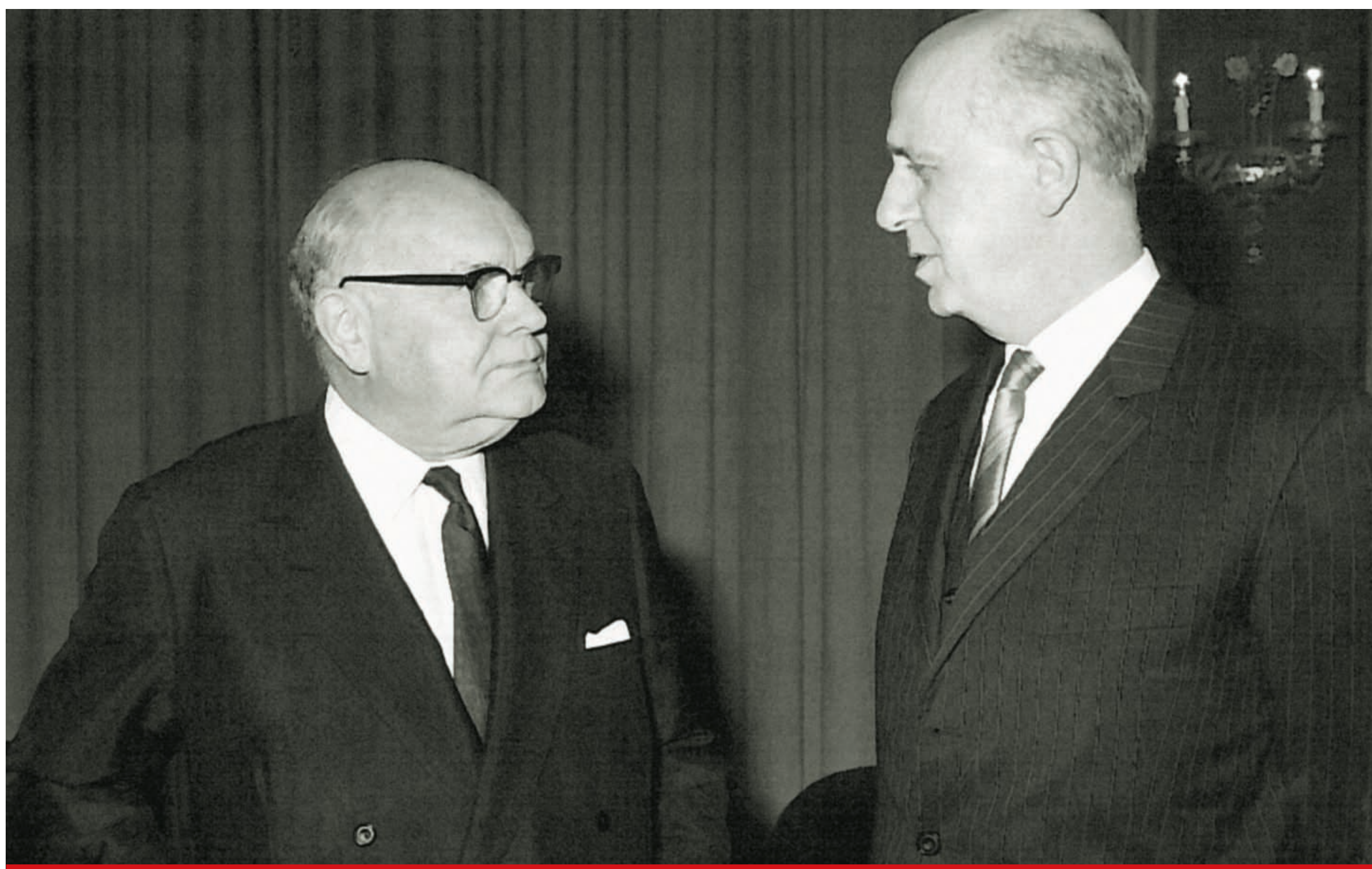
Paul-Henri Spaak, Ministre des Affaires étrangères et Pierre Harmel, Premier ministre .