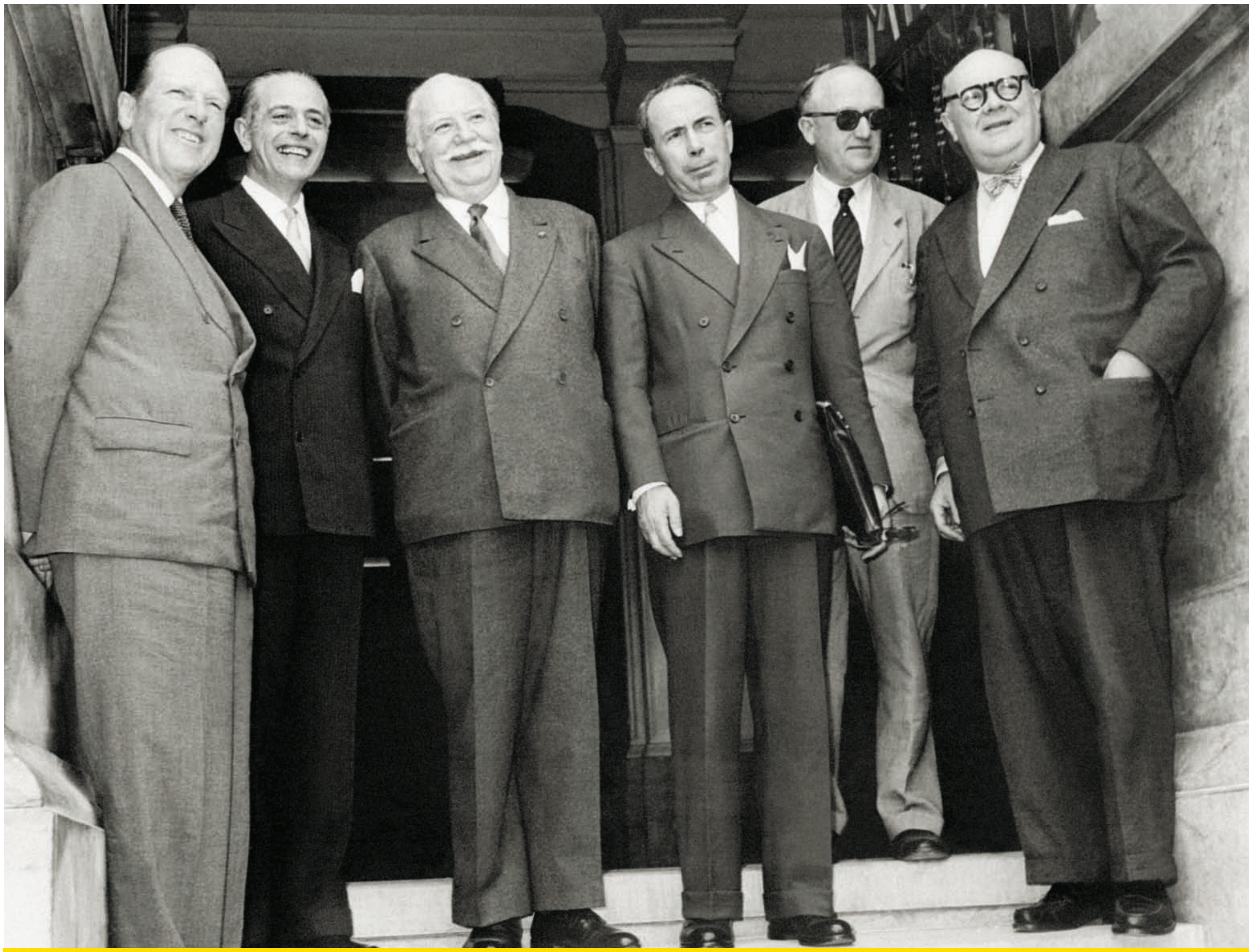
1955, Messine – Italie. Réunion des ministres des Affaires étrangères des Six pour relancer le processus de construction européenne: Jan Willem Beyen (Pays-Bas), Gaetano Martino (Italie), Joseph Bech (Luxembourg), Antoine Pinay (France), Walter Hallstein (RFA) et Paul-Henri Spaak (Belgique).