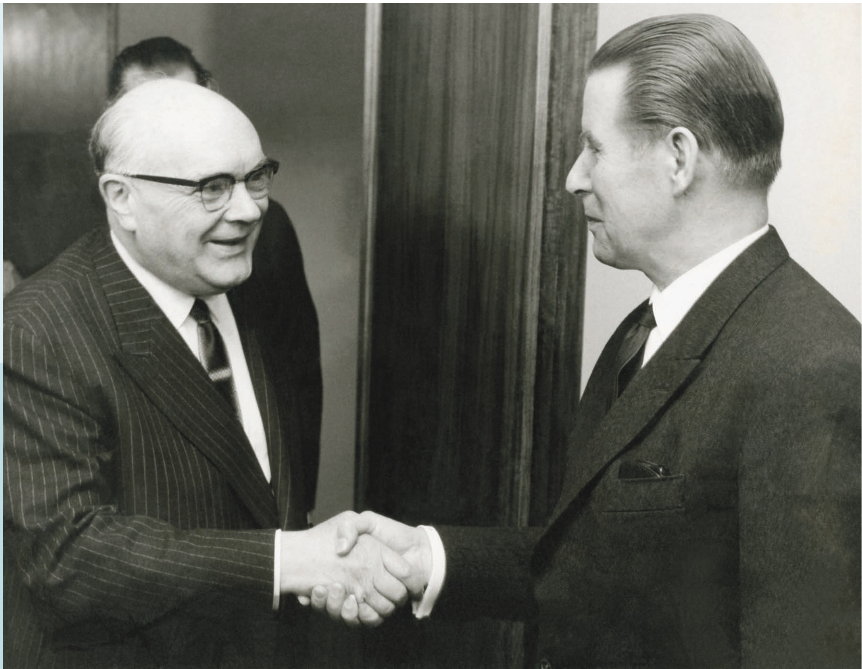
Paul-Henri Spaak, ministre des Affaires étrangères, est reçu par le ministre Gerhard Schröder – 22 mars 1965.

L'homme d'Etat influent sur la scène internationale De Staatsman met invloed op de internationale scène An influential statesman on the international stage