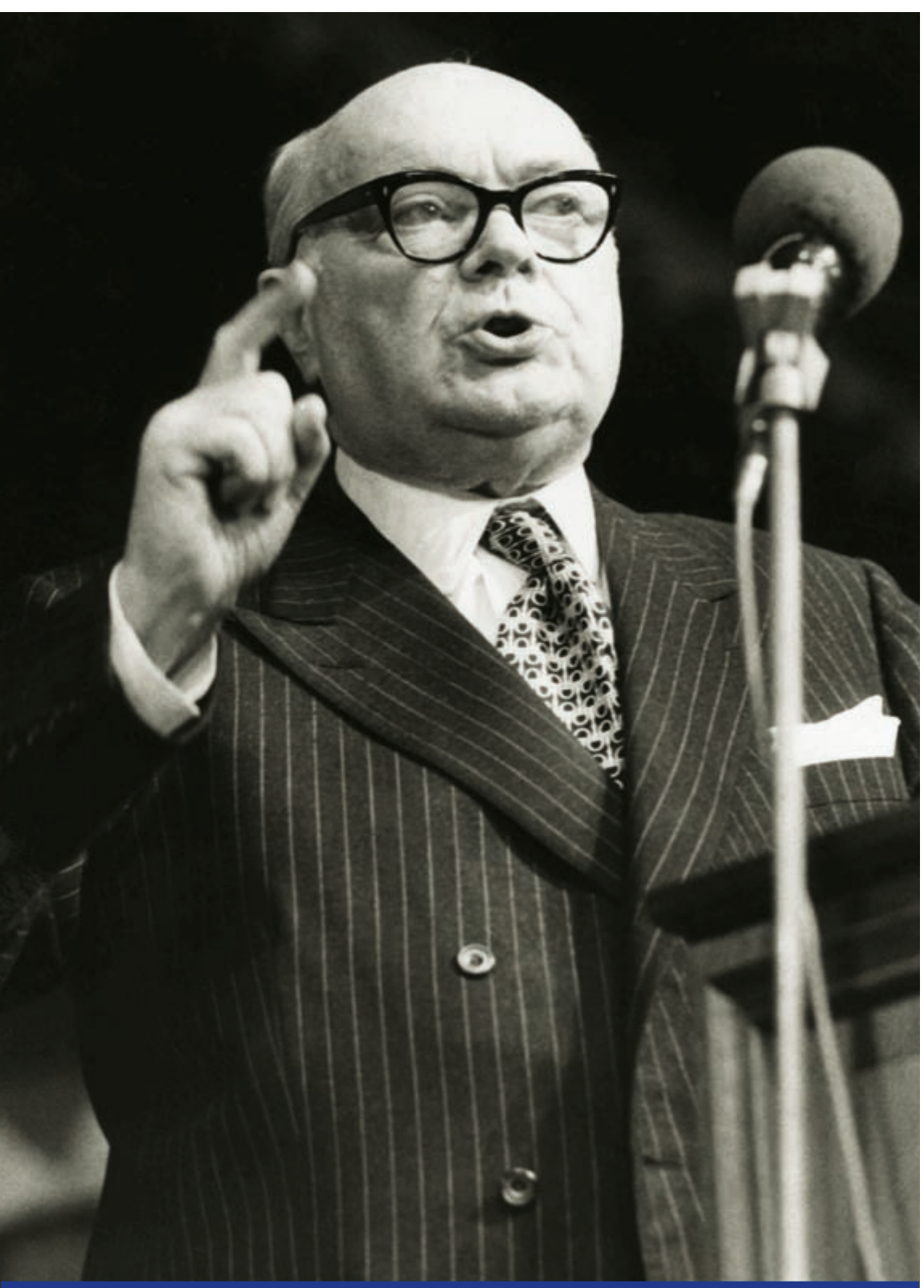
Paul-Henri Spaak, un très grand orateur

Paul-Henri Spaak est le père d'Antoinette Spaak, première femme à avoir présidé un parti politique en Belgique (FDF) de 1977 à 1982. Ministre d'Etat depuis 1983, Antoinette Spaak a été présidente du Conseil de la Communauté française de 1988 à 1992.