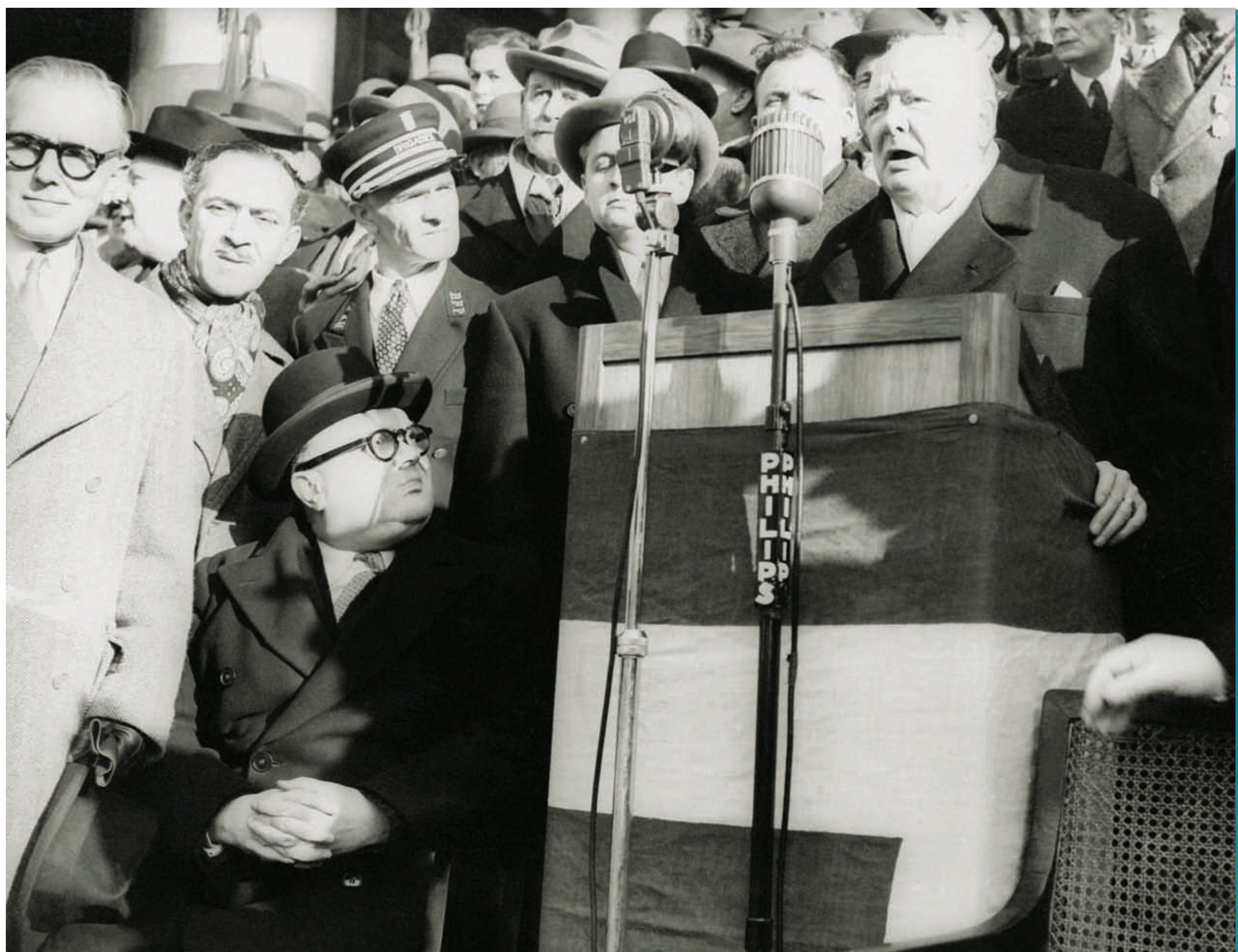
1949 - Winston Churchill, créateur du Mouvement pour l'Europe unie, rencontre Paul-Henri Spaak, Premier ministre belge et ministre des Affaires étrangères.