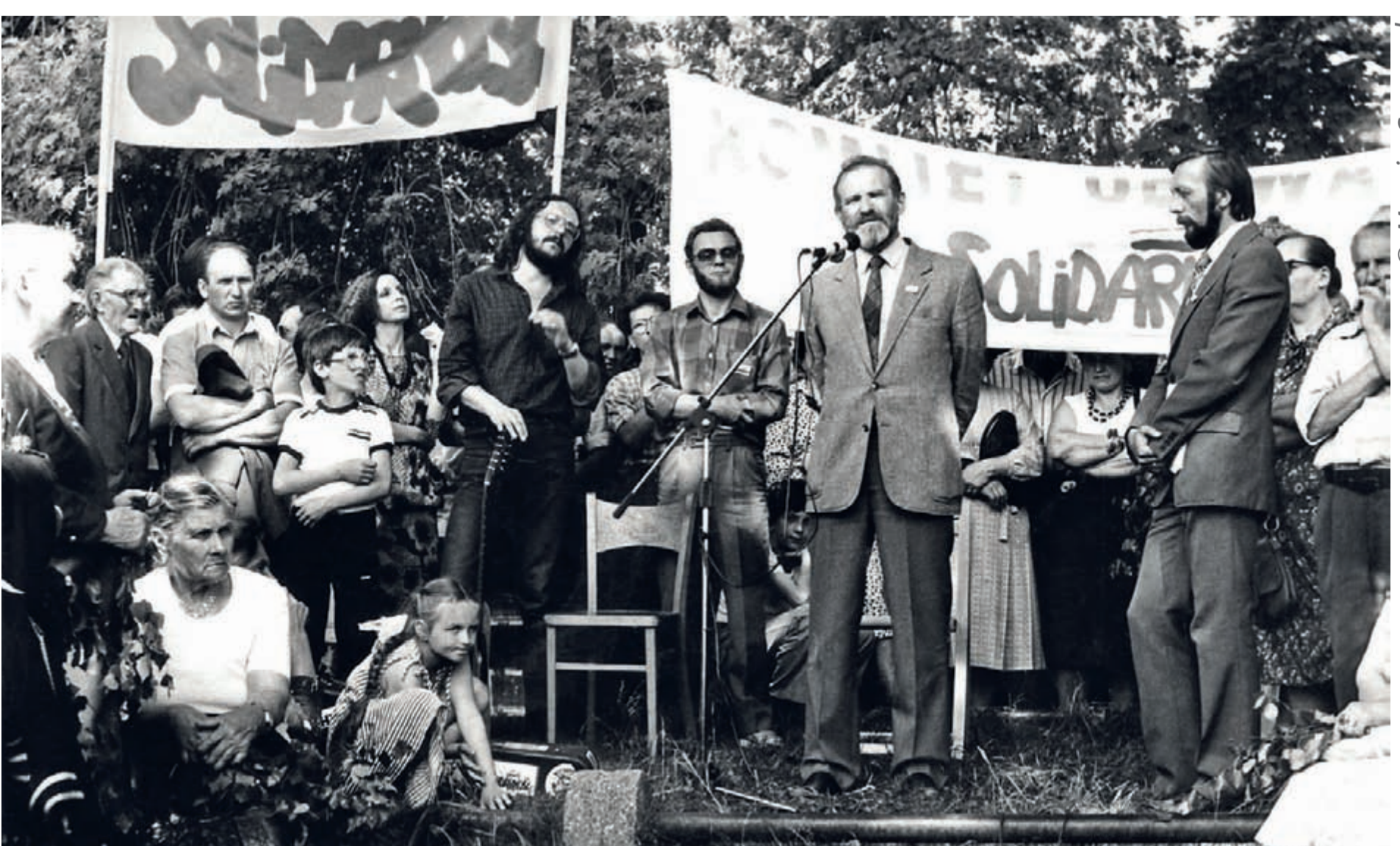
Mragowo, 1980. Manifestation syndicale. Mragowo, 1980. Vakbondmanifestatie.

Membre de l'opposition démocratique dès les années '70, il cofonda et anima "l'Université volante" dont le but était d'enseigner l'histoire de la Pologne contemporaine et la lutte contre la censure imposée par le régime communiste. En 1980, en tant qu'intellectuel engagé, il soutint les ouvriers polonais en grève dans les chantiers navals de Gdansk et devint rapidement un des piliers du mouvement de l'opposition.