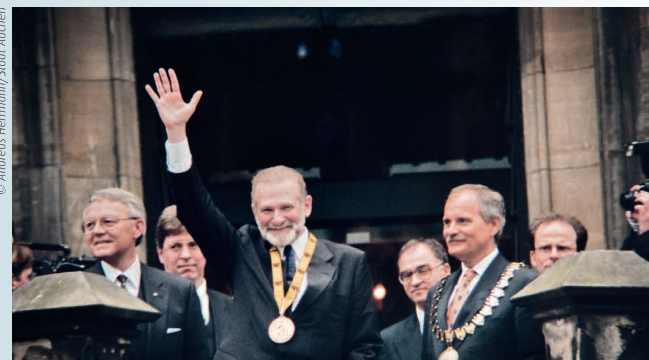
Aix-la-Chapelle, 1998. Bronisław Geremek reçoit le Prix international Charlemagne. Aken, 1998. Bronisław Geremek ontvangt de Karelsprijs.

Als Minister van Buitenlandse Zaken van de Republiek Polen tussen 1997 in 2001 was hij de architect van de toetreding van Polen tot de NAVO in maart 1999. Tegelijkertijd speelde hij een onschatbare rol om Polen dicht bij Europa te brengen en pleitte hij voor de toetreding van Polen tot de Europese Unie (EU). In juni 2004, na de toetreding van Polen tot de EU, werd Bronisław Geremek verkozen tot lid van het Europees Parlement onder de kleuren van zijn partij, de Unie voor de Vrijheid (UW). Dit bleef hij tot 13 juli 2008, de datum van zijn overlijden in een verkeersongeval in Polen. Hij was lid van de centrumfractie Alliantie van Liberalen en Democraten voor Europa (ALDE). Tijdens deze periode woonde hij in Sint-Lambrechts-Woluwe, in de de Broquevilleaan nr. 98. Zijn strijd tegen totalitarisme was onlosmakelijk verbonden met zijn bijdrage aan de Europese eenmaking. In 1998 ontving hij de Internationale Karelsprijs Aken. Als onvermoeibare "bruggenbouwer" tussen Europa en Polen was hij de steunpilaar van de Europese inspiratie na de dood van de grondleggers Jean Monnet, Konrad Adenauer en Robert Schuman.