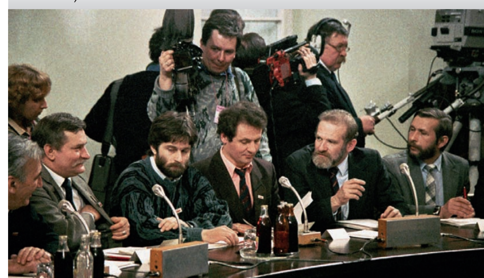
Varsovie, 1989. La Table Ronde. Warschau, 1989. De Ronde Tafel.

In 1989 nam Bronisław Geremek deel aan de zogenaamde onderhandelingen van de "Ronde Tafel" tussen Solidarność en vertegenwoordigers van het stervende communistische regime, die leidden tot een democratische overgang, zonder geweld, waarvan hij bijzonder veel belang heette. Tussen 1989 en 2001 was hij lid van de Poolse Sejm (het Lagerhuis van het Poolse parlement) en voorzitter van de parlementaire Commissie voor Buitenlandse Zaken.