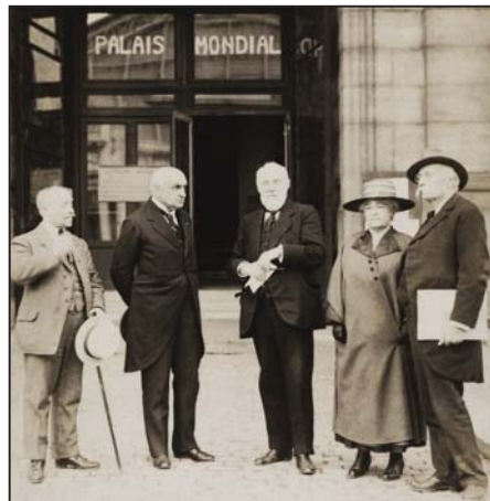
Paul Otlet (au centre) et Henri Lafontaine (à droite) devant l'entrée du Palais mondial au Palais du Cinquantenaire, sans date