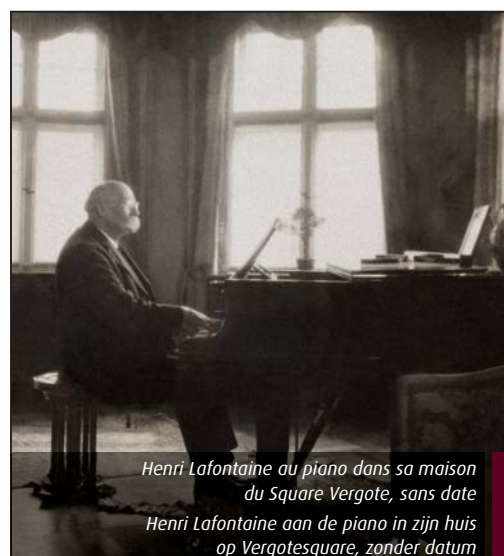
Henri Lafontaine au piano dans sa maison du Square Vergote, sans date Henri Lafontaine aan de piano in zijn huis op Vergotesquare, zonder datum

Henri Lafontaine ontwikkelt al heel jong een passie voor muziek, vooral voor Mozart en Wagner. Hij speelt piano en frequenteert de artistieke en muzikale kringen van Brussel. In 1885 publiceert hij de eerste Franse vertaling van enkele werken van Wagner. Hij geeft conferenties over componisten en vertolkt soms zelf bepaalde stukken.