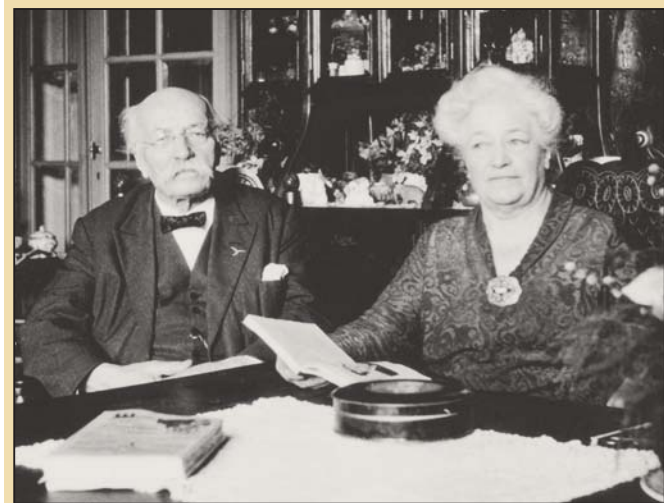
Henri Lafontaine et son épouse dans la salle à manger de leur maison Square Vergote, 1932

En 1968, la commune de Woluwe-Saint-Lambert donne le nom d'Henri Lafontaine à une nouvelle artère du quartier Hof ten Berg afin de perpétuer le souvenir de cette éminente personnalité.