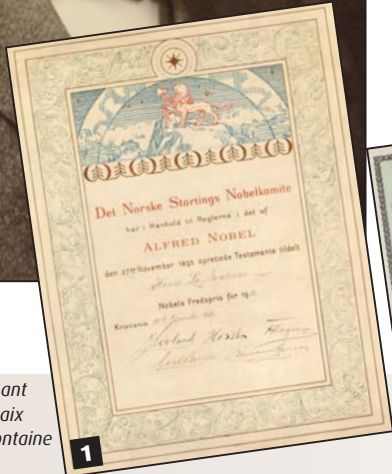
1. Diplôme accompagnant le prix Nobel de la paix attribué à Henri Lafontaine en 1913

Henri Lafontaine is geboren in 1854. Na zijn rechtenstudies aan de Universiteit libre de Bruxelles begint hij in 1877 een carrière als advocaat; daarnaast houdt hij zich met tal van andere activiteiten bezig die vooral in het teken staan van vrede, gelijkheid en democratie. Zijn ideeën vinden weerklank in de Senaat, de Volkenbond, het Internationaal Instituut voor Bibliografie oftewel Mundaneum, en ook in de vrijmetselaarsloges. In deze kringen verdedigt Henri Lafontaine het gebruik van het internationaal recht, de oprichting van een Volkenbond, de emancipatie van de vrouw, de uitbreiding van de democratie en de toegang tot kennis voor iedereen.