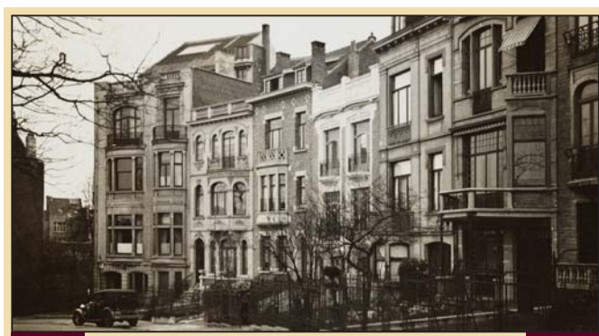
Square Vergote, où l'on aperçoit la maison qu'Henri Lafontaine (la première à gauche) a occupée de 1909 à sa mort en 1943, sans date

Henri Lafontaine schrijft zelf zijn naam in twee woorden ("La Fontaine"). Zowel in zijn eigen geschriften als in de publicaties over hem komt deze schrijfwijze voor. In officiële stukken wordt zijn naam echter in één woord gespeld.