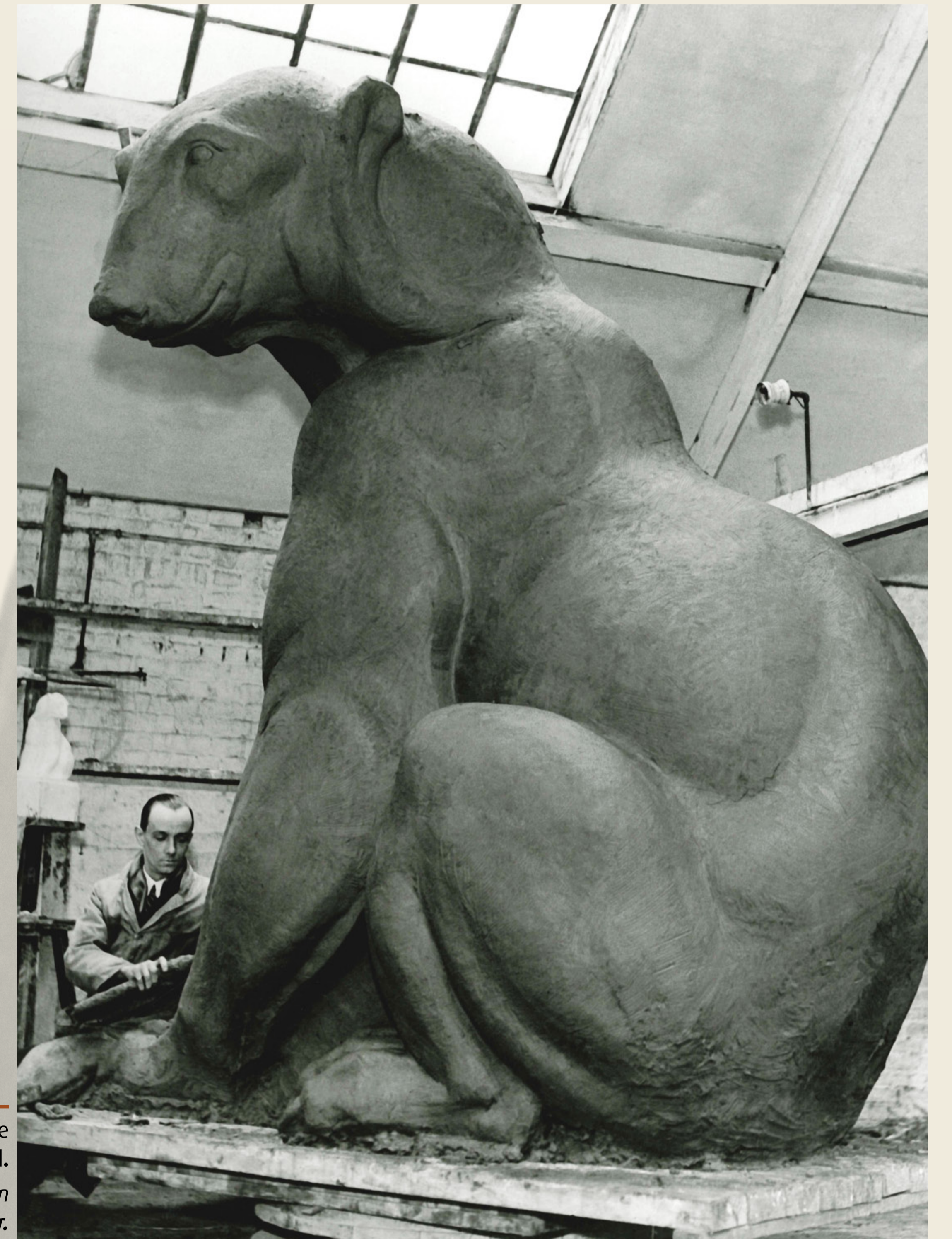
Finition de l' Ours polaire monumental . Afwerking van de monumentale ijsbeer .