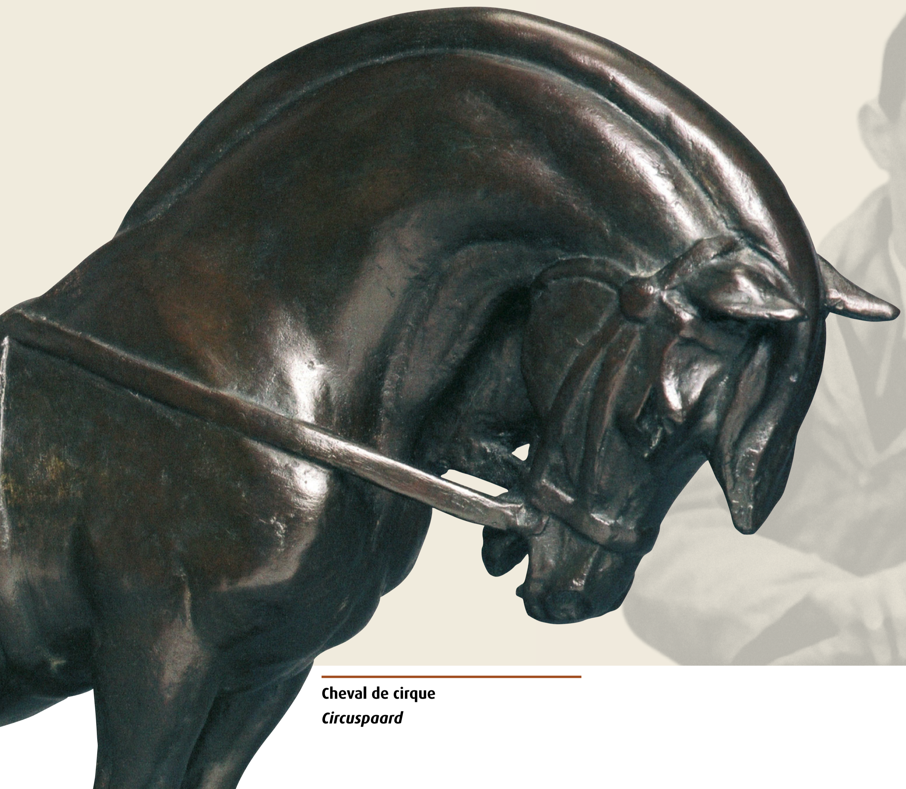
Cheval de cirque Circuspaard