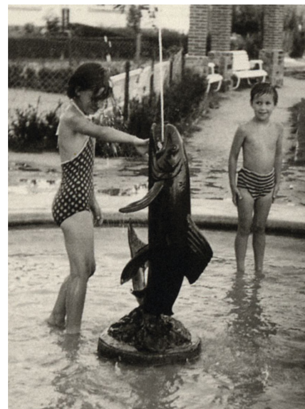
Saumon. Fontaine, clos du Grootveld à Woluwe-Saint-Lambert, vers 1960 Zalm. Fontein, Grootveld in Sint-Lambrechts-Woluwe, rond 1960