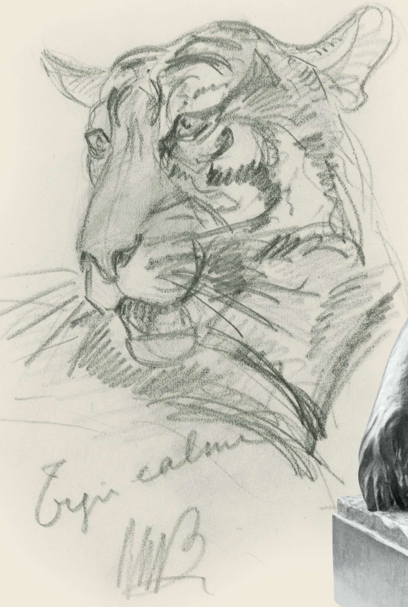
Tigre calme Croquis, ca. 1930 Kalme tijger Schets, ca. 1930