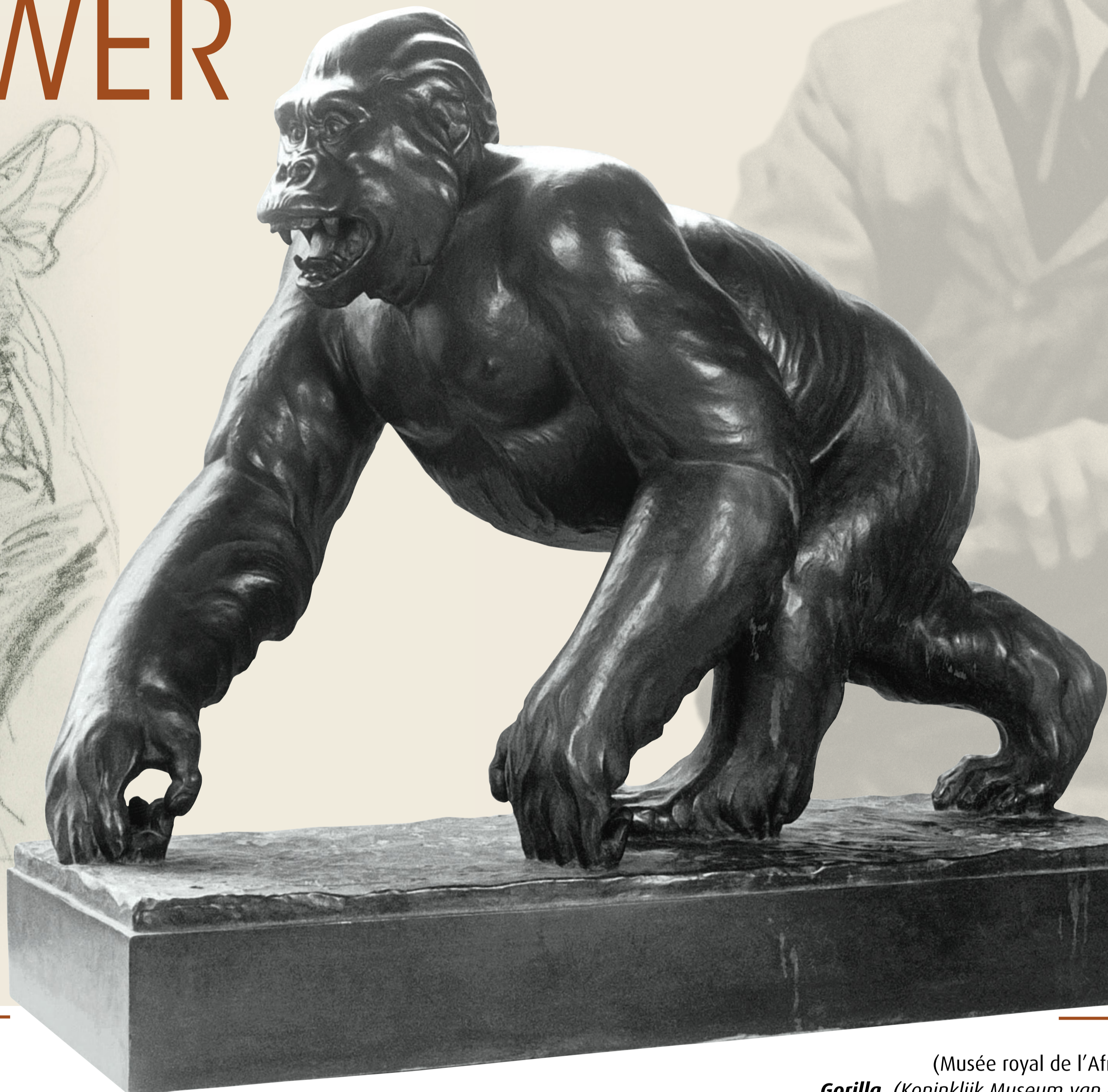
Gorille (Musée royal de l'Afrique centrale, Tervuren) Gorilla. (Koninklijk Museum van Centraal Afrika, Tervuren)

Raymond de Meester de Betzenbroeck est né à Malines le 1 er décembre 1904 et est décédé à Woluwe-Saint-Lambert le 30 novembre 1995.