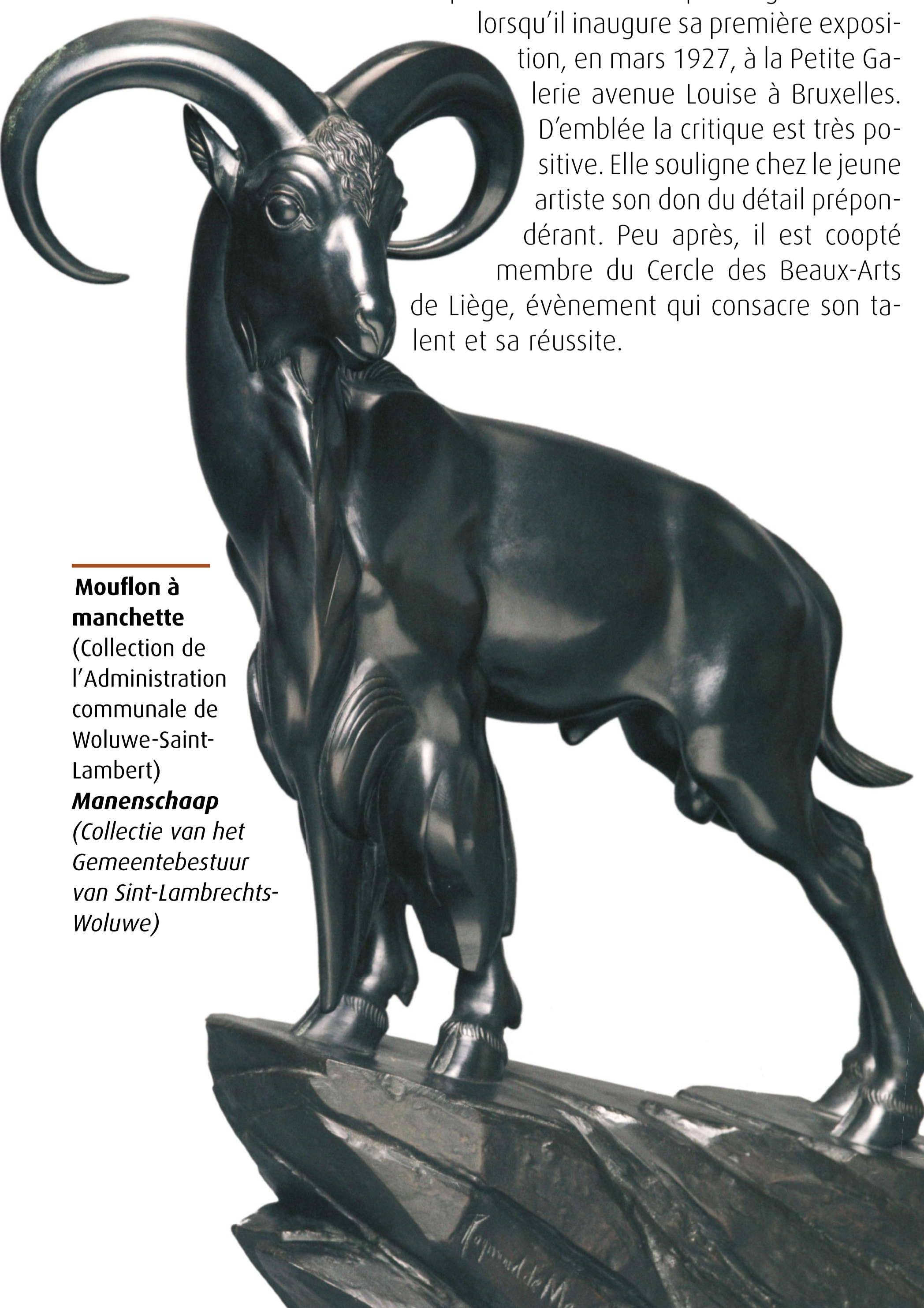
Mouflon à manchette (Collection de l'Administration communale de Woluwe-Saint-Lambert) Manenschaap (Collectie van het Gemeentebestuur van Sint-Lambrechts-Woluwe)