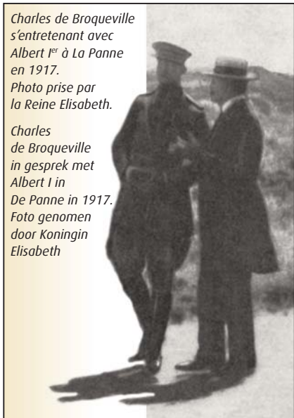
Charles de Broqueville s'entretenant avec Albert I er à La Panne en 1917. Photo prise par la Reine Elisabeth. Charles de Broqueville en gesprek met Albert I in De Panne in 1917. Foto genomen door Koningin Elisabeth

En 1918, après la libération du pays, il intégra la nouvelle équipe ministérielle, placée sous la direction de Léon Delacroix, en tant que ministre de l'Intérieur.