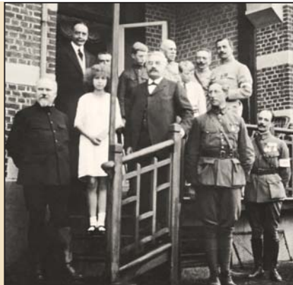
Koninklijke villa in De Panne: Raymond Poincaré (Président van de Franse Republiek), Prinses Marie-José, Alexandre Millerand, Prins Karel en onderaan de trap Koning Albert I. Achteraan: Charles de Broqueville, Prins Leopold, Generaal Pétain. Foto genomen in 1917 door Koningin Elisabeth.