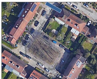
Rue scolaire et mesure complémentaire : sens unique dans l'avenue Cassiopée